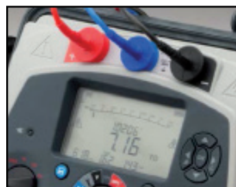
Grand écran LCD rétro-éclairé

Au-dessous d'un niveau minimum acceptable de résistance d'isolement, la tension doit rapidement baisser pour protéger l'équipement en essai et permettre sa remise en état.