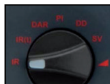
Bouton rotatif de sélection clair et précis. Comprends : RI, IR(t), DAR, IP, DD; Ecart à a loi d'Ohm (SV) et Test de Rampe