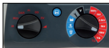
interrupieur rotatif pour une utilisation intuitive sur le terrain