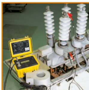
Mesure du rapport d'un transformateur de courant