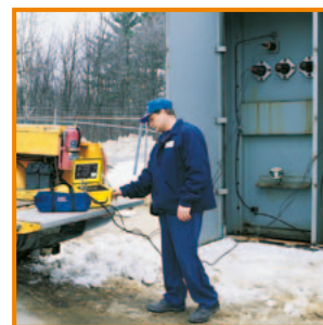
Sur le terrain, mesure sur transformateur triphasé 2000 kVA