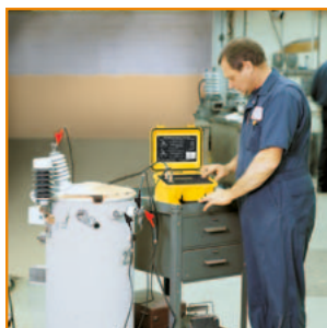
Mesure sur un transformateur en atelier