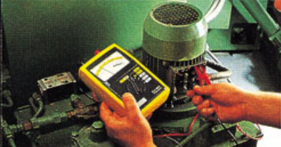
Contrôle de l'isolement des enroulements d'un moteur.